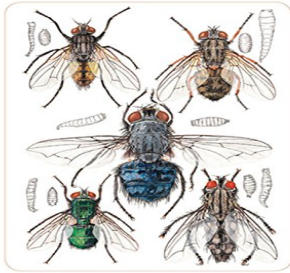
La faune des cadavres JEAN-PIERRE MÉGNIN De Natura Horum Klincekulek